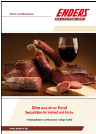
"Spezialitäten für Verkauf und Küche" Teilkatalog "Fleisch- und Wurstwaren" 01/2012

» zu den einzelnen Kapiteln « » Download als PDF (ca. 12,0 MB) «