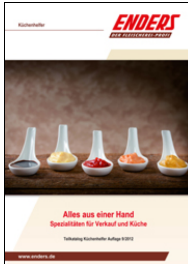
"Spezialitäten für Verkauf und Küche" Teilkatalog "Küchenhelfer" 09/2012

» zu den einzelnen Kapiteln « » Download als PDF (ca. 15,4 MB) «