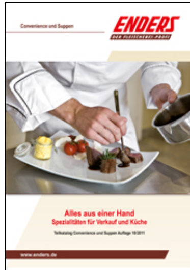
"Spezialitäten für Verkauf und Küche" Teilkatalog "Convenience/Suppen" 2011/2012

» zu den einzelnen Kapiteln « » Download als PDF (ca. 8 MB) «