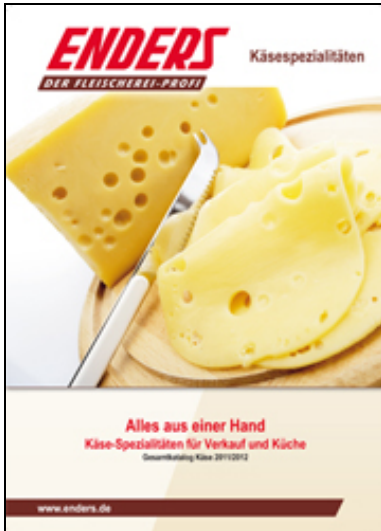
"Spezialitäten für Verkauf und Küche" Teilkatalog "Käsespezialitäten" 2011/2012

» zu den einzelnen Kapiteln « » Download als PDF (ca. 8 MB) «